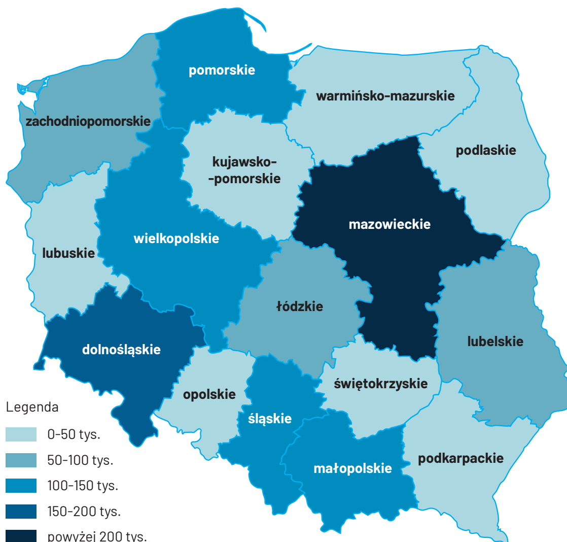
Mapa 1. Zarejestrowane wnioski o nadanie statusu UKR w 2022 r. wg województw.